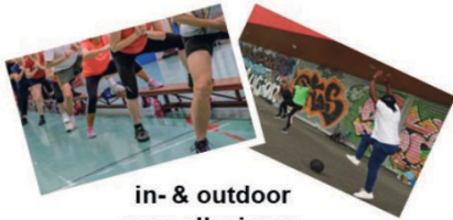
in- & outdoor voor elk niveau

Gratis proefles? Bel of mail: 06 - 2081 4646 conditietrainengaasperdam@gmail.com